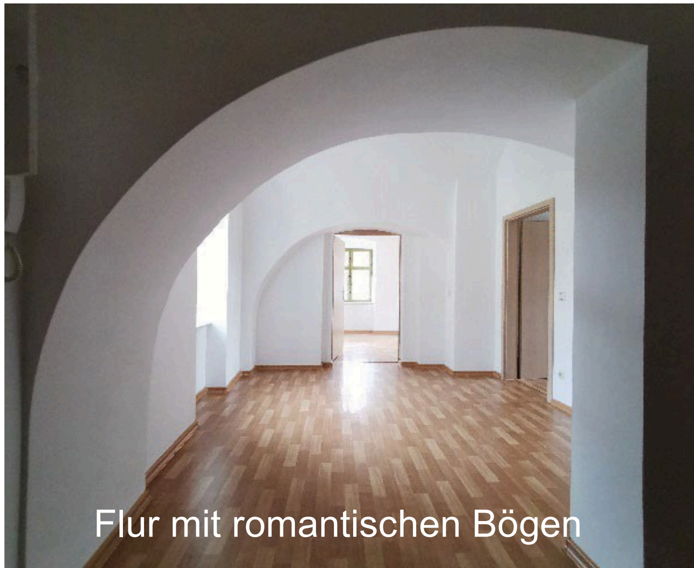
Flur mit romantischen Bögen