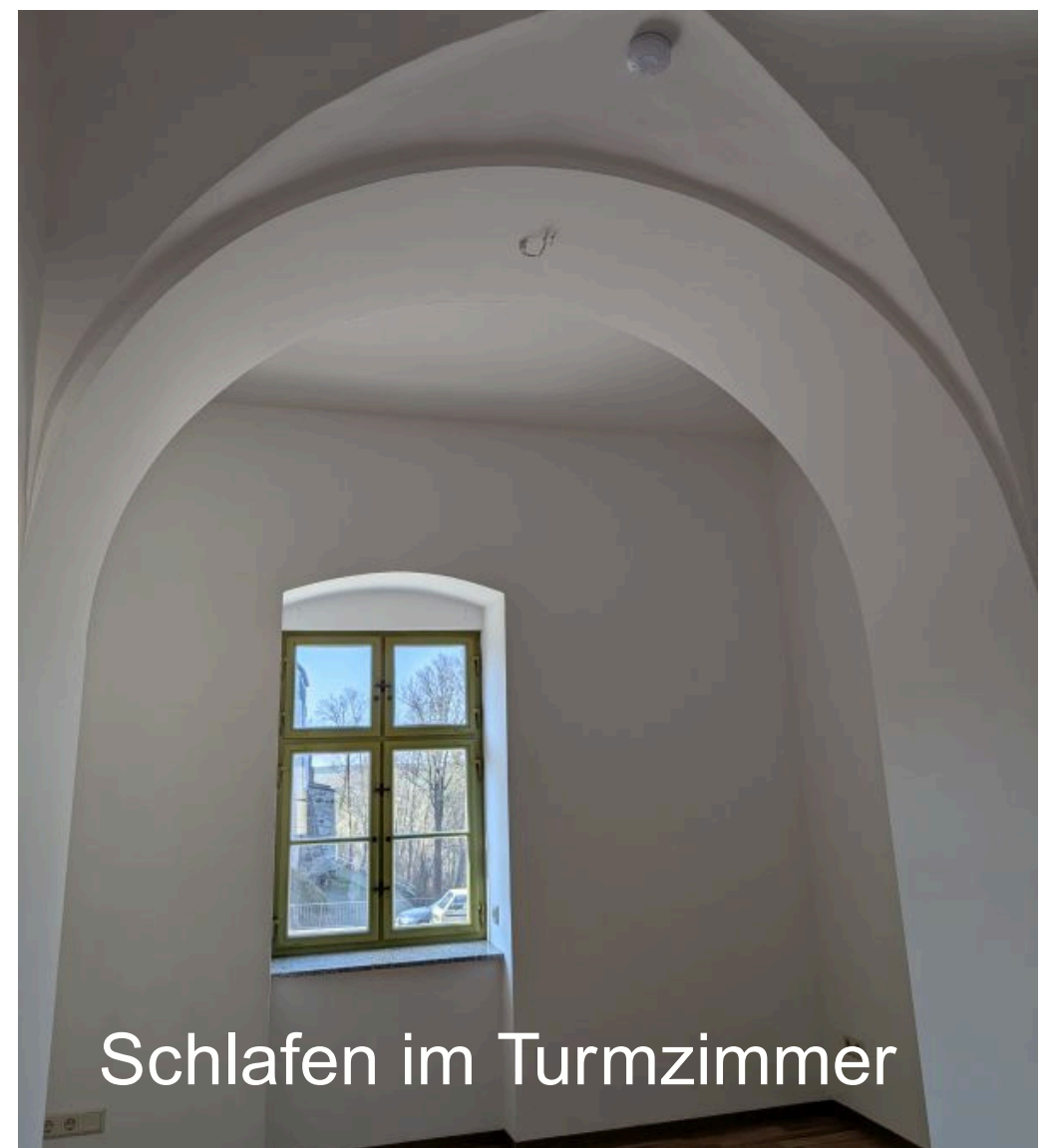
Schlafen im Turmzimmer