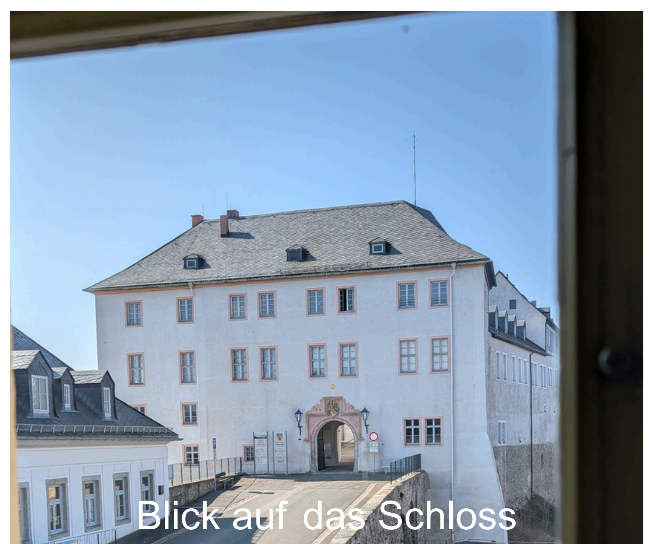
Blick auf das Schloss